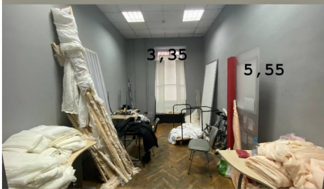
Кімната 1.1 (19.0)